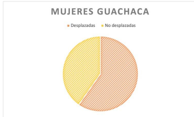
Grafico1:Antecedentes de las mujeres en el corregimiento de Guachaca.

En la fundación Costeño Social al promover un espacio para la libre expresión y desarrollo de la personalidad, se invita a reflexionar críticamente desde las ideas de equidad e igualdad de posibilidades para crecer y desarrollarse como ser humano.