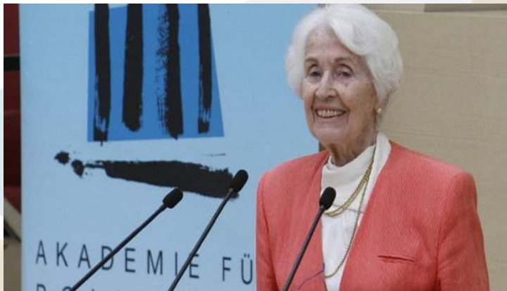
Hildegard Hamm-Brücher, política que fue parte de la delegación Alemana que participó en la CONFINTEA III que se realizó en Tokio.

En esta conferencia se dio más valor a la función de conservación y mantenimiento de la paz por medio de la educación y también el papel de empleabilidad y el aspecto económico de la educación de personas adultas. Se hizo hincapié en la importancia de reconocer el derecho a aprender.